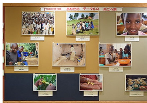
“品尝并传递‘高田之梦’！TFT世界粮食日活动”限期菜品与食堂内占满整面宣传栏的支援对象照片