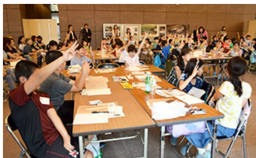
积极参加环境教室的孩子们

在日本，绿海龟在小笠原群岛的沙滩上产卵。随着海岸的开发沙滩面积缩小，绿海龟的产卵场所减少，并且发生了绿海龟误食海岸垃圾等情况，人类活动对自然界造成了巨大的影响，人类的生活与绿海龟息息相关。作为绿海龟保护活动的一个组成部分，2016年7月，我们面向港区青山附近的小学生和员工家庭开设了“环境教室”，通过绿海龟学习生物和环境的重要性。要建设更具可持续性的社会，需要每一个人在日常生活中注重环保。从这一角度出发，作为提高环保关注度活动的一个组成部分，从1992年开始，每年夏天我们都面向当地儿童开设环境教室，迄今为止累计共向约1,200多名肩负着下一代的小学生提供了学习环境保护和生物多样性保护的