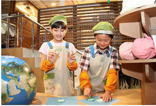
手工制作再生皂的情形