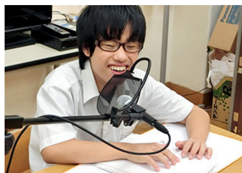
全盲的中学生凭借盲文为我们朗读了百人一首