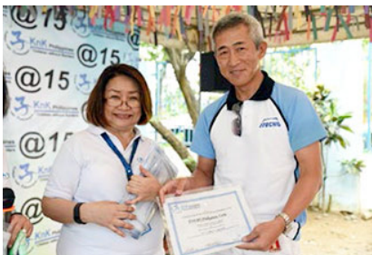
在Knk菲律宾15周年纪念仪式上获赠感谢状

2016年5月，举行了KnK菲律宾活动15周年纪念仪式，马尼拉支店的6名员工带着深受孩子们喜爱的快餐食品参加了庆祝活动。另外，10月至11月期间，总公司的年轻员工在该设施及贫民窟地区巴雅塔斯进行了志愿者体验，12月在少年之家举办圣诞派对时，当地11名员工带去了快餐食品、冰激凌和圣诞礼物，通过游戏和短剧表演等与孩子们进行了深入的交流。