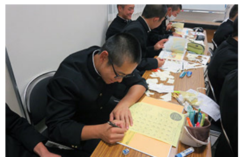
大船渡高中的学生在粘贴翻译贴纸

伊藤忠从开展“在日语绘本上贴上翻译成当地语言的贴纸赠送给东南亚儿童活动”的公益财团法人Shanti国际志愿者会购买了成套工具，与伊藤忠纪念财团携手合作，每周由员工志愿者将翻译成当地语言的贴纸贴在绘本上，自2014年起，将该活动的范围扩大到灾区儿童。2016年度，在福岛、岩手、宫城3县的家庭文库、图书馆、中小学和高中等16地开展了活动，在当地开展儿童读书活动的7家团体的协助下，参加活动的人数达到了462人次。