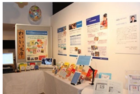
皇后陛下曾视察过的“图书的力量展” (多媒体DAISY图书展示 2014年)

2016年应残障中小学生的需要，完成了电子版的小仓百人一首。由就读于都立特别支援学校的高中生朗读，由10所都立高中美术部的学生将诗歌的情景绘制成插图。而且任天堂株式会社无偿制作并提供了图书的电子数据等，是在多方面的协助之下完成的。