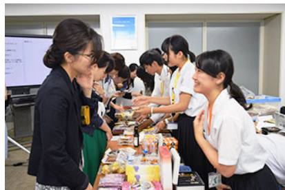
滋贺县立八幡商业高中的学生们展示并介绍自己购买的日本各地的土特产