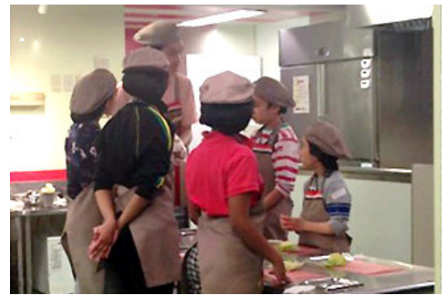
在KidZania收获满满的巴西中小小学生