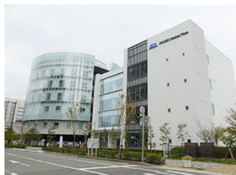
伊藤忠医疗广场外观

2014年10月，以国际医疗交流为目的，在国内最大的医疗产业集群神户医疗产业都市设立的设施“伊藤忠医疗广场”开业。伊藤忠商事向公益财团法人神户国际医疗交流财团捐赠了5亿日元的建设资金。以东南亚为中心面向各国医生、医疗相关从业人员实施的教育、技术培训等的人才培养事业、海外培训生的接收事业、与大学等合作的医疗器械开发事业、面向地区医疗相关人员的研讨会等各类研究事业等，在日本国内外有望取得进一步发展。2016年度，在国际医疗交流事业方面，与11所海外的大学和医疗设施进行了交流。此外，以医疗经营讲座为主题，面向地区医疗从业人员举办了3场有助于医院经营方面的讲座，共计182人次参加了讲座。并且举办了2场医工联合人才培养课程，共计124人次参加。