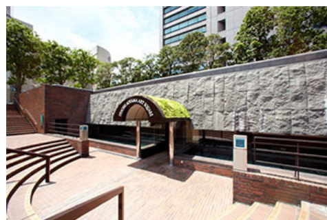
伊藤忠青山艺术广场外观

2012年10月，作为社会企业责任（CSR）的据点在东京总公司相邻的CI广场开设了“伊藤忠青山艺术广场”。通过艺术，以“培养下一代”、“地区贡献”、“国内外的艺术及文化振兴”等为目的，新鲜的感性洋溢的优秀作品展以及作为国际交流的桥梁的各种活动，这条街道充满着的各种文化气息，从东京的青山传播开来。2016年度共计举办了如下所示的14场展览会，截至2017年3月末，开幕以来的参观人数已经达到了约17万人。今后，伊藤忠将通过艺术致力于各种社会性课题，以定期举办展览会的方式，争取对地区的创造生活文化做出贡献。