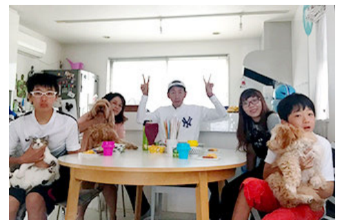
中国大学生（右2）和寄宿家庭

这是以日中友好为目的，每年两次邀请中国的大学生访问日本，促进民间交流的项目，2016年度5月举办了第18届，12月举办了第19届，伊藤忠集团有3名员工作为东道主接待了中国大学生，与家人一起来访者进行了民间层面其乐融融的交流。