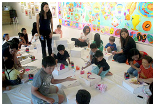
“HAPPY BIRTHDAY EARTH 展览会 ~ 用孩子们的画为地球换上新装 ~” 工坊 “大家一起在白布上作画!!”