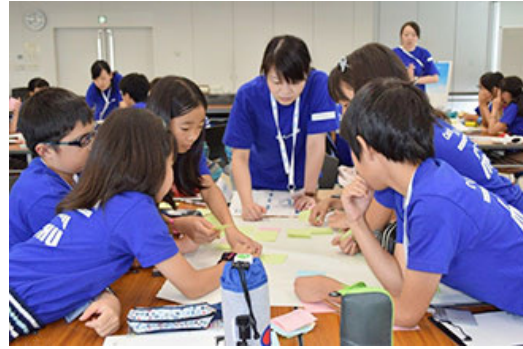
参加Out of KidZania的孩子们 认真交流想法的情景