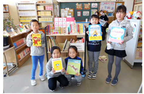
获得捐赠的女川小学孩子们

活动自2012年起开展，通过将发送给股东们的信息电子化，把节约下来的纸张和邮递费用等用于支持伊藤忠纪念财团开展的文库捐赠。2016年度，获得了4,958名股东的支持，伊藤忠商事也拿出了同等金额的资金，由伊藤忠纪念财团通过当地书店，将新发行的套装图书捐赠给在东日本大地震中严重受灾的下列10所学校。