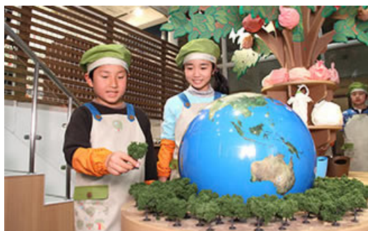
每当有一名儿童参加活动，便会向“绿化带运动”捐赠一棵造林用树苗的费用

2012年4月，伊藤忠商事在儿童职业体验乐园“趣志家 (KidZania) 东京”馆内，开设了可以让孩子们体验环保活动的环境体验馆“环保作坊”。在该体验馆内，每当有一名儿童参加活动，便会向肯尼亚的造林活动“绿化带运动”捐赠一棵造林用树苗的费用。截至2017年3月，已经有大约15万名儿童参加了活动，约有相当于15万棵树苗的费用被捐赠到了肯尼亚。这些费用除了用于在肯尼亚开展造林活动以外，还被用于持续森林再生活动时的雨水存积、以及以灵活运用生态健康型森林资源为目的的当地居民工作室的実施活动等方面。自2017年起，为了推进“亚马逊海牛野化放归事业”（海牛回家项目），体验馆以“亚马逊生态系统保护”为主题进行了翻新，计划将体验馆来访人数×10日元的金额捐赠给巴西，用作亚马逊海牛的牛奶费用。