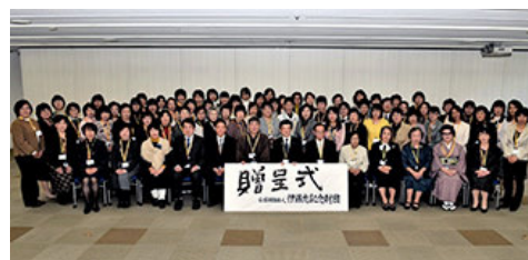
伊藤忠纪念财团召开了一年一度的儿童文库助成事业捐赠仪式