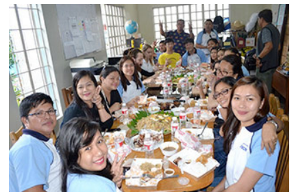
与伊藤忠商事马尼拉支店的志愿者们