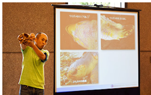
环境教室的授课情形