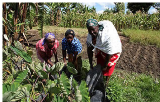
肯尼亚的植树造林活动