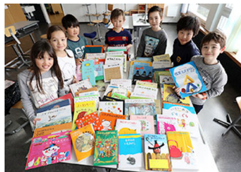
接受资助的瑞士祖格日语学校

※ 在对东日本大地震灾区开展的支援中，通过与各位股东共同实施的“捐赠儿童图书100册”进行了10例捐赠，详情请参阅P89。