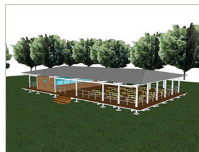
Field Museum内的Visitor Center（完成效果图）