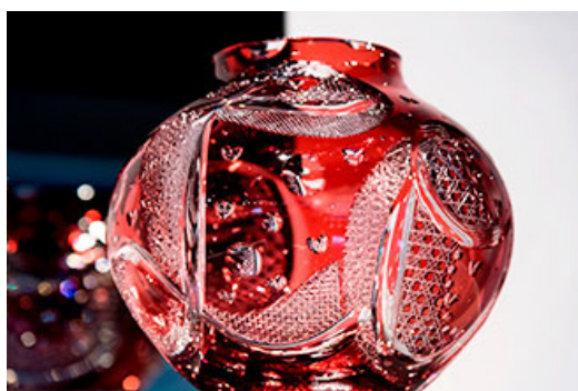
“江户玻璃雕花年轻工匠10人展 ~ 玻璃和玻璃雕花 ~”