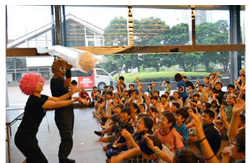
“自然灾害教室”现场