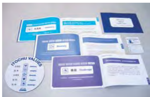
为了使公司理念在公司内部深入人心，公司特意制作了小册子（日文、英文、中文）、便携式卡片、鼠标垫发放给每一名员工。