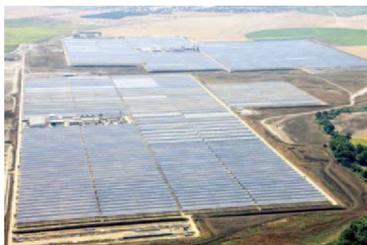
Abengoa公司经营的相同规模的发电站

※电价补贴制度(Feed-in Tariff)：旨在促进可再生能源利用的优惠价格电力购买制度。