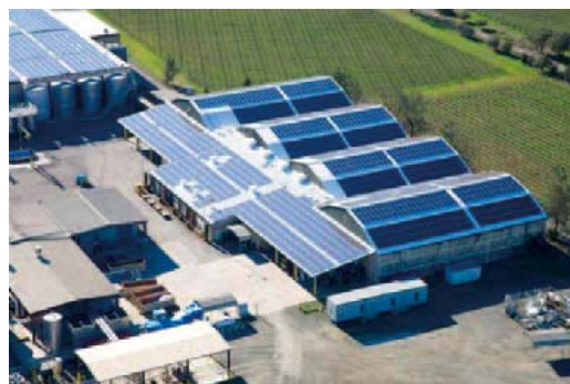
SolarNet销售·施工案例 加州Beringer Vineyards

※系统集成商：整合太阳能电池模块和附带设备，进行太阳能发电系统的设计、销售、施工的业者的总称。