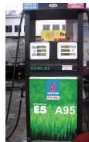
乙醇混合汽油加油站

伊藤忠商事与越南国营石油天然气总公司Petrovietnam集团的Petro-vietnam Oil公司共同参与位于越南南部平福省的燃料用生物乙醇生产项目。本项目所生产的生物乙醇是以越南本地种植的甘蔗为主要原料，预计从2012年春开始投产，年产量将达到10万KL。生产出的生物乙醇主要通过Petro-vietnam Oil公司旗下的加油站进行销售。越南国内生产的乙醇替代燃料有望推动今后乙醇混合汽油的生产和供应。