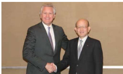
GE杰弗里·伊梅尔特CEO与伊藤忠商事网藤社长

2010年5月，伊藤忠商事与GE就挖掘全球可再生能源领域共同投资项目的事宜，达成全面合作协议，并签署了谅解备忘录。预计可再生能源领域中全球规模的投资机会将会增多，因此伊藤忠商事极力加强与战略伙伴间的关系，目前正与GE共同参与着两个风力发电项目。