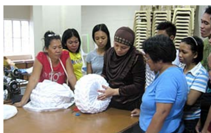
手工艺品制作的职业训练