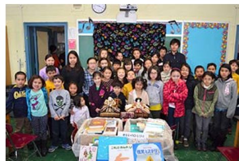
美国Connecticut州Hartford日语学校的学生们

今后，仍将在孩子们人气高涨的设施“KidZania东京”里，通过提供以全球的视角来快乐学习环境保护的场所，致力于培养将承担可持续社会的青少年。