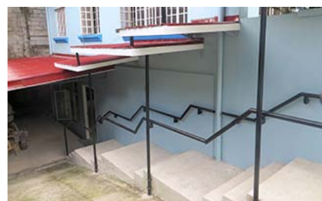
“少年之家”改装后的外部楼梯