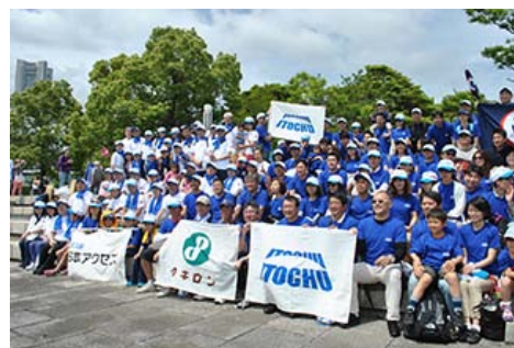
参加杜绝孩子的饥饿宣传运动“Walk the World”

2014年5月，伊藤忠商事及伊藤忠集团成员公司的270名员工参加了在横滨举办的杜绝孩子的饥饿的宣传运动“Walk the World”。此外，在东京总部还定期举办介绍WFP的展览和募捐活动。