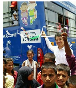
开幕式时汇集而来的孩子们