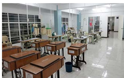
翻新的地下操作室