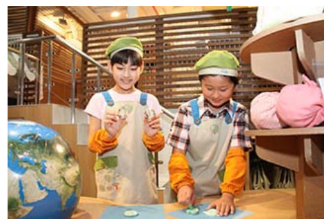
手工制作再生皂的情形