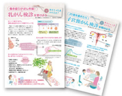
鼓励进行妇科检查的宣传页

该公司还开始开展“让企业 and 人都富有活力”的新活动。该公司的女性员工实施了多项针对职业女性的健康支援措施，以提高妇科检查（乳腺癌、子宫颈癌）的就诊率，例如制作并分发关于疾病教育及鼓励就诊等的宣传页（包含2015年度健康体检的介绍），同时还多次召开仅限女性参加的小型研讨会。