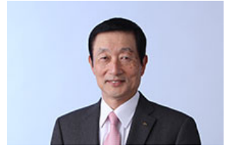
粮油食品公司 总裁

同时，从针对作为全人类规模的课题的粮食问题的观点出发，将致力于确保粮食资源的稳定供应源的工作。确保食品的安心、安全是本公司最重要的课题，为确保粮食交易中的安全性，我们采取了广泛的措施，例如根据海外供应商的管理体制、商品特点、加工工序中卫生方面的风险等个别情况，分别设定访问监查的对象、频率等。今后我们将进一步加强包括投资对象、合作伙伴在内的管理体制。