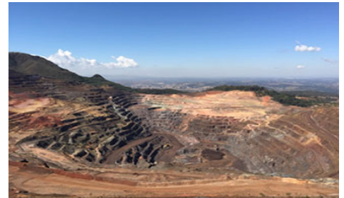
Casa de Pedra 矿山

2015年11月，本公司与其他股东一起将目前拥有的巴西铁矿石生产公司NAMISA和该公司在当地的合作伙伴CSN公司的矿山部门进行了合并。CSN公司的矿山部门不仅拥有规模和质量方面闻名世界的Casa de Pedra 矿山，还持有运输铁矿石的铁道公司的股份以及装运铁矿石的港湾码头，合并后的公司将具备世界顶级的矿山和优质的物流服务，成为可实现全部业务一条龙化的矿山公司。本项目不仅仅是单纯的有形资产的合并，还将亚洲、巴西的实力型企业在经营、作业、销售方面各自的优势集合起来，以期实现事业上的协同效果和成长。今后也将通过本事业的成长继续为巴西的经济发展和资源的稳定供应做出贡献。