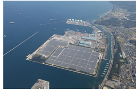
大分日吉原太阳能发电站全景

2016年3月，与株式会社九电工、三井造船株式会社共同创立的事业——大分日吉原太阳能发电站开始商用运转。本发电站建设在三井造船大分事业所拥有的约46万平方米的场区内，可发电输出44,800kW，是一个大规模的兆瓦级光伏电站。该发电站的发电量为每年5,250.011万kW/h，可满足约9,300户普通家庭的年电力需求，同时，预计将减少相当于3万2,000吨的CO 2 的排放。并计划将发电的电力在20年内销售给九州电力株式会社。本公司还在冈山县（预定2016年12月竣工，发电输出约为3.7万kW）以及佐贺县（预计2018年4月竣工，发电输出约为2.1万kW）积极推进同样大规模的太阳能发电站的建设。本公司将通过在日本国内外积极推进利用可再生能源的发电事业，为防止地球变暖等的环境保护以及建设循环型社会做出贡献。