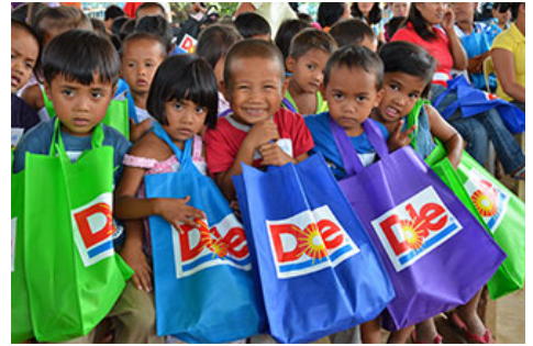
拿着由Dole赠送的学习用品的孩子们

2015年, 在菲律宾、斯里兰卡、日本、韩国、中国、北美等国家和地区, DOLE投入了200万美元从事公益事业, 例如向约60所学校捐赠课本、桌椅、电脑等物品; 维修保养校园设施; 支付约300项奖学金; 为残疾儿童提供教育机会; 向受灾地区提供生活必需品与医疗援助; 开展献血、卫生教育、粮食援助等旨在维持与促进身体健康的活动; 完善住宅与基础设施; 捐赠农业设备; 对农户进行技术指导; 为地区活动提供赞助等, 激发地区活力; 并开展诸如提供资源循环利用方案、保护河流、监测CO2排放量等环境保护活动等。