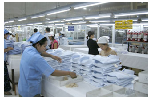
TI GARMENT COMPANY LIMITED的实际状况调查

在支撑着纺织公司原点“产品制造”的全球化适地生产体制中，同时关注着供应链上的劳动惯例和环境，努力推进可持续的产品制造。我们认为得到供应商对本公司采购相关方针的理解和支持是非常重要的，因此，正在推进与符合“伊藤忠商事供应链CSR行动指针”的供应商的合作。另外，包括集团成员公司在内，正在持续开展对国内外生产工厂的监督调查，2015年度与外部专家一起，对日本国内从事内衣制造的株式会社ROYNE、缅甸的衬衣生产据点TI GARMENT COMPANY LIMITED进行了实际状况调查。今后将努力不断提高供应链管理精度。