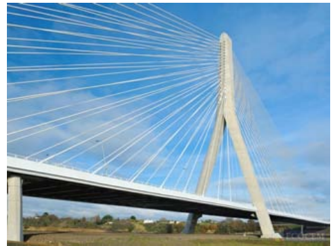
使用了高炉炉渣的建筑物