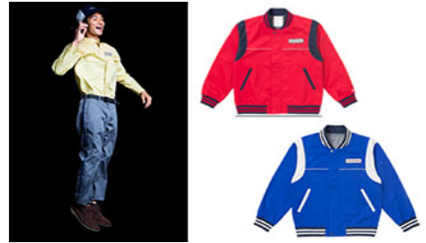
使用环保材料的伊藤忠ENEX株式会社的制服

该委员会以在2020年前将1,000万人的制服更改为环保型制服为目标，该项目的第一次活动就是将伊藤忠ENEX株式会社的加油站工作制服全部焕然一新。在该项目中，伊藤忠商事与纤维制造商合作，企划并生产了使用再生聚酯的环保型制服。此外，还支援了株式会社REBIRTH PROJECT与其主要客户株式会社BONMAX共同推进的“WORK 4 BANGLA项目”，接受了有机棉制T恤等的生产委托。今后，在面向企业的制服事业方面，作为强化提案能力的重要环节，将努力推进以可持续性社会为目标的环保型业务。