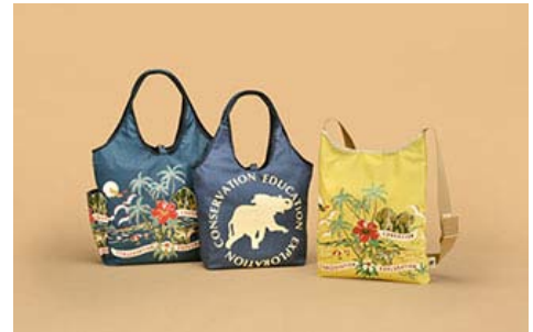
狩猎世界的慈善挎包

※ 绿色回廊：是指通过对森林保护区或保护林之间的土地采取回购等措施，将被分割的森林连接起来，为野生动物创造可以自由往来的通道，从而保护生物多样性的活动。