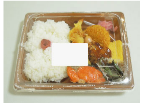
采用侧面密封包装的便当

※2015年度实际成果（与传统保鲜膜相比）：减少塑料原料 约400吨，减少CO2约1,450吨