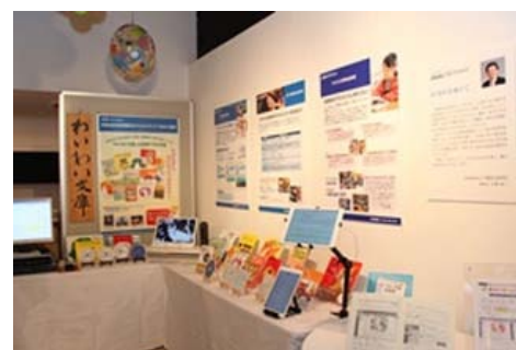
2014年“图书的力量展”多媒体DAISY图书的展示