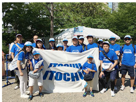
参加杜绝孩子的饥饿宣传运动“Walk the World”（左图为横滨的活动情形，右图为大阪的活动情形）