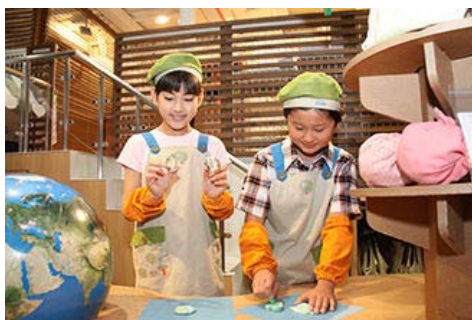
手工制作再生皂的情形

2015年8月，作为可以实际体验商社的工作的特别项目，在东京总部历时两天举办了“Out of KidZania便利店商务的职业体验”。这一项目是从伊藤忠商事所涉足的众多事业中选出“便利店”作为项目主题，以孩子们独有的视角设计集团企业“全家”的店铺方案和商品促销方案，创建孩子们所认为的客户喜爱的“未来便利店”。将小学生所设计的销售方案真正用于店铺等，这是只有通过伊藤忠商事的Out of KidZania活动才能获得的独特、珍贵的体验。今后，仍将在孩子们人气高涨的设施“KidZania东京”里，通过提供以全球的视角来快乐学习环境保护的场所，致力于培养将承担可持续社会的青少年。