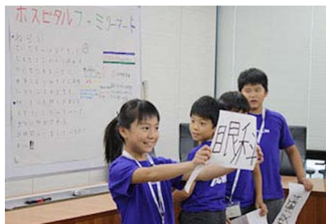
参加Out of KidZania的孩子们进行“未来便利店”展示的情形