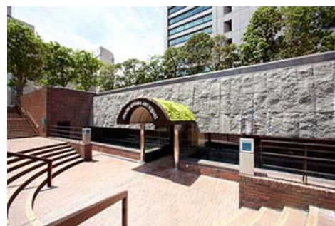
伊藤忠青山艺术广场外观

今后，伊藤忠将通过艺术致力于各种社会性课题，以定期举办展览会的方式，争取对地区的创造生活文化做出贡献。