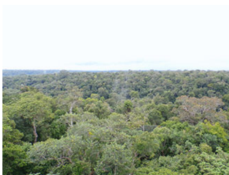
亚马逊的热带雨林是世界上最大的热带雨林，据称地球上三分之一的氧气都产自这里。

亚马逊地区的热带雨林面积占全球热带雨林的一半以上，甚至被称为“生态系统的宝库”。但是，由于经济迅速发展及当地居民缺少环保教育导致森林遭到砍伐等，近年来该地区珍贵的生态系统正在不断消失。京都大学野生动物研究中心与巴西国立亚马逊研究所联合开展研究及普及活动，以保护亚马逊珍贵的生态系统，双方运用日本擅长的尖端技术，合作开展与保护相关的研究并修建了设施，以往研究难度较大的亚马逊水生生物（淡水豚及海牛）以及热带雨林上层部分的研究等与多样化生物及生态系统相关的保护研究有望取得飞跃性的进展。救助濒危物种亚马逊海牛活动也是其中的一项活动，伊藤忠商事对亚马逊海牛野化放归项目给予了支援。因偷捕而受伤、被保护起来的海牛数量不断增加，而另一方面，待其具备自理能力后放归大自然较为困难，因此，确立海牛的野化放归项目成为当务之急。通过伊藤忠商事的支援，力争在3年后使野化放归的海牛数量达到9头以上，半野化放归的海牛数量达到20头以上。