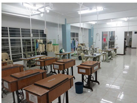
改建后的地下缝纫教室

通过旨在援助发展中国家的流浪儿童和大规模灾害中的受灾儿童的认定NPO法人儿童无国境（KnK），2009年12月，支援位于菲律宾马尼拉郊外的青少年自立支援设施“少年之家”重新装修运营，2012年，支援旨在帮助儿童未来实现自立的职业培训设施进行改建。另外，2013年11月，通过对该设施的地下及屋顶进行改装，使得以学会实践性技术为目标的职业训练课程可望扩充。此外，自2015年度开始，再次为“少年之家”的运营提供资金支持，所捐赠善款用于教育、膳食、心理安抚、职业训练等活动，以使“少年之家”的孩子们重拾尊严、成长为能够奉献社会的人。另外，本公司的支援也帮助KnK菲律宾的活动趋于稳定，被评价为是活动得以持续开展的有力后盾。