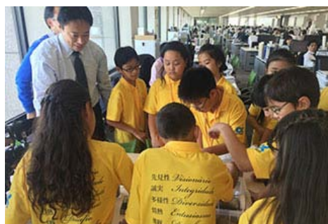
参观伊藤忠商事东京总部金属公司的工作现场