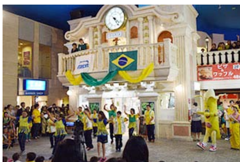
巴西中小學生在KidZania表演舞蹈

另外，2016年4月17日扩大了邀请对象范围，邀请了茨城、东京、神奈川、千叶、埼玉的在日巴西中小學生约45人前往KidZania东京体验。