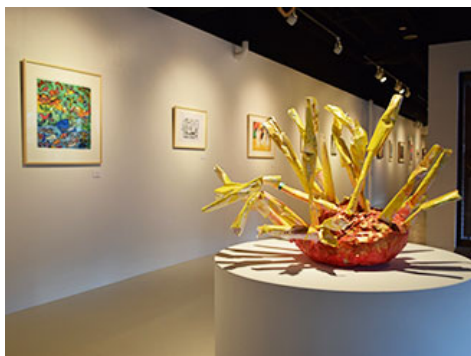
“东京都立特别支援学校 艺术项目展 ~为东京街道增添色彩~”