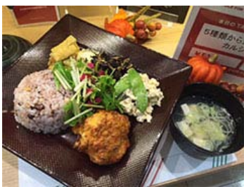
在“第1届 两人的餐桌大赛”中荣获菜单部门大奖的“5种可选的补钙家常菜”

2015年10月，配合10月16日的世界粮食日，开展了“品尝并传递‘高田之梦’！TFT世界粮食日活动”，开发的期间限定菜单使用了伊藤忠集团支援的陆前高田市品牌大米“高田之梦”的新米，不仅可以支援东日本大地震复兴，还可以促进国际合作，此外还利用视频开展TFT宣传活动等，开展了独具特色的活动。此外，在2015年7月的“第1届 两人的餐桌大赛”中，通过由引入TFT的企业CSR负责人等约180人投票，2014年度世界粮食日活动菜单“5种可选的补钙家常菜”荣获了菜单部门的大奖。2015年度，共售出22,896份TFT套餐，加上伊藤忠商事的等额配捐，合计捐赠了915,840日元（换算TFT套餐45,792份）。此类活动得到了高度评价，伊藤忠商事于2016年5月获得表彰，被评为“黄金赞助商”。