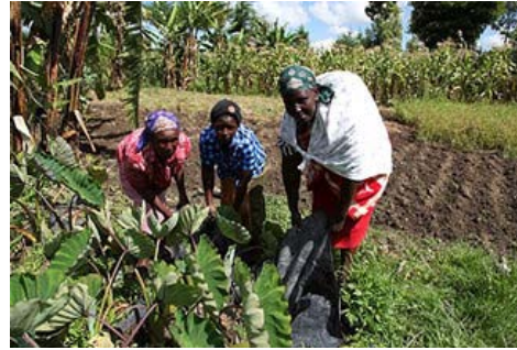
肯尼亚的植树造林活动