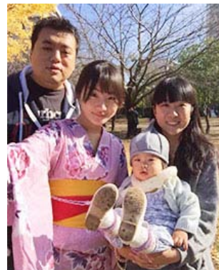
身着和服的中国大学生和房东一家

这是以日中友好为目的，每年两次邀请中国的大学生访问日本，促进民间交流的项目，继2011年度5月举办了第16届之后，今年11月举办了第17届该项目，伊藤忠集团分别有3名员工作为东道主接待了中国大学生，与家人一起来访者进行了民间层面其乐融融的交流。