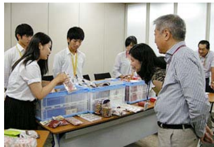
滋贺县立八幡商业高中的学生展示并介绍自己购买的日本各地的土特产