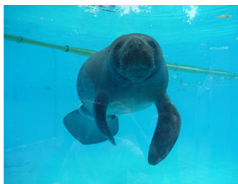
濒危物种亚马逊海牛