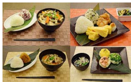
“品尝并传递‘高田之梦’！TFT世界粮食日活动”期间限定菜单