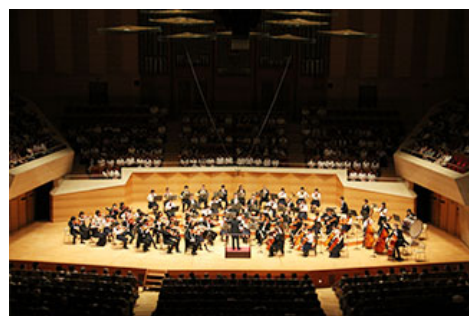
在三得利大厅的首次演奏