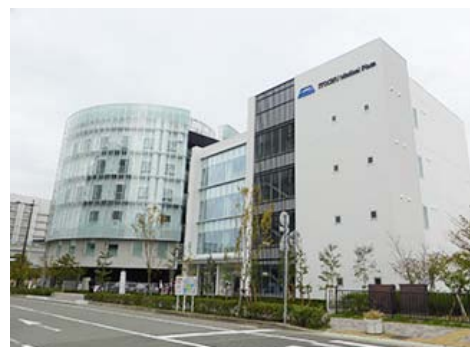
伊藤忠医疗广场外观

2014年10月，以国际医疗交流为目的，在国内最大的医疗产业集群神户医疗产业都市设立的设施“伊藤忠医疗广场”开业。伊藤忠商事向公益财团法人神户国际医疗交流财团捐赠了5亿日元的建设资金。以东南亚为中心面向各国医生、医疗相关从业人员实施的教育、技术培训等的人才培养事业、海外培训生的接收事业、与大学等合作的医疗器械开发事业、面向地区医疗相关人员的研讨会等各类研究事业等，在日本国内外有望取得进一步发展。2015年度以医疗经营讲座为主题，面向地区医疗从业人员举办了5场有助于医院经营方面的讲座，共计332人次参加了讲座。