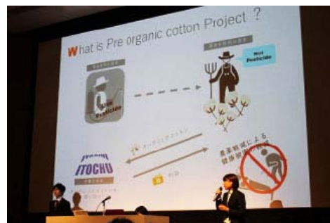
明治学院大学团队的展示

在2015年举办的第6届竞赛中，伊藤忠商事支援了明治大学牛尾研讨会和明治学院大学GSR研究会，明治大学团队的“解决非洲婴儿高死亡率”的项目获得了“独特奖”。