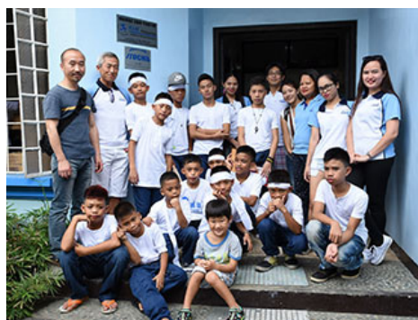
伊藤忠商事马尼拉分店的员工参加在菲律宾开展儿童无国界（KnK）活动15周年纪念仪式