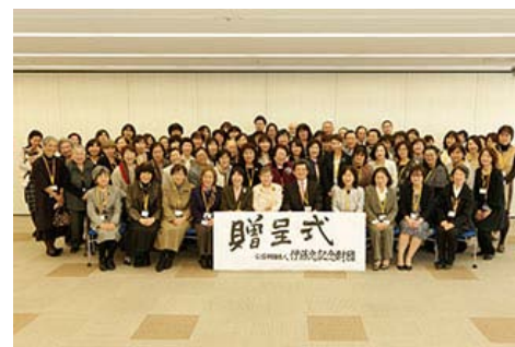
伊藤忠纪念财团召开了一年一度的儿童文库助成事业捐赠仪式

多媒体DAISY图书是指面向因为各种身体残疾而难以使用普通的图书进行阅读的儿童，将儿童图书电子化进行发放的事业，截止目前已有243部作品实现了电子化，累计向4,327处机构进行了捐赠。