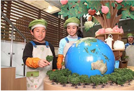
每当有一名儿童参加活动，便会向“绿化带运动”捐赠一棵造林用树苗的费用

2012年4月，伊藤忠商事在儿童职业体验乐园“趣志家 (KidZania) 东京”馆内，开设了可以让孩子们体验环保活动的环境体验馆“环保作坊”。在该体验馆内，每当有一名儿童参加活动，便会向肯尼亚的造林活动“绿化带运动”捐赠一棵造林用树苗的费用。截至2016年3月，已经有大约12万名儿童参加了活动，约有相当于12万棵树苗的费用被捐赠到了肯尼亚。这些费用除了用于在肯尼亚开展造林活动以外，还被用于持续森林再生活动时的雨水存积、以及以灵活运用生态健康型森林资源为目的的当地居民工作室的实施活动等方面。