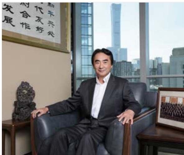
伊藤忠商事代表取締役 副社長執行董事 东亚地区总代表