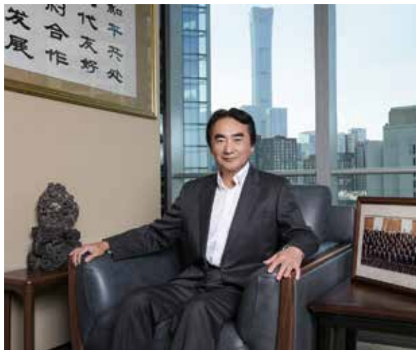
伊藤忠商事代表取缔役 副社长执行董事 东亚地区总代表