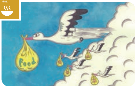
5歳未満の子供の発育阻害やあらゆる形の栄養不良を解消しよう。(2-2)