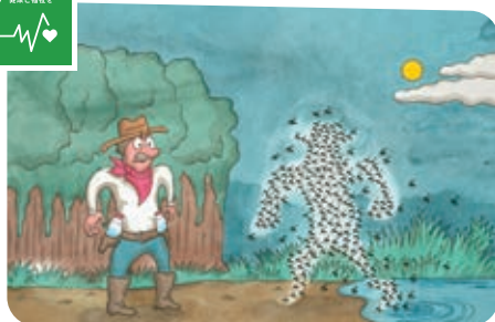
マラリアやエイズ、結核、その他の熱帯病などの伝染病を根絶しよう。(3-2)