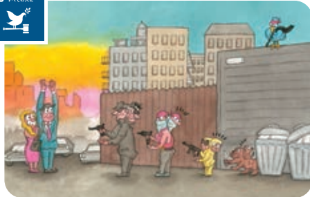
あらゆる場所での暴力および暴力による死亡率を大幅に減らそう。(16-1)