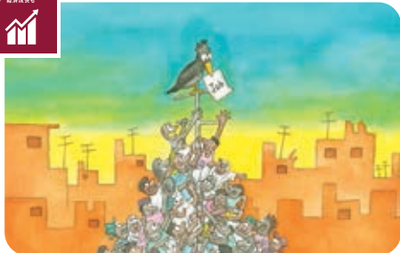
不安定な雇用状態にある労働者の権利を守り人間的らしい労働環境を実現しよう。(8-8)