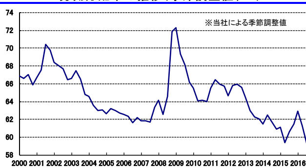
労働分配率の推移(季節調整値、%)