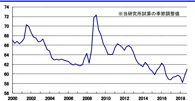
労働分配率の推移(季節調整値、%)