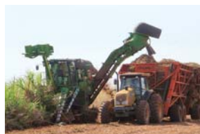
収穫中のサトウキビ

米穀物メジャーのBunge社と2008年からブラジルのミナスジェライス州及びトカンチンス州においてサトウキビを原料とするバイオエタノールと砂糖の生産・販売事業を展開しています。エタノール生産能力を両プロジェクトの合計で約50万KLまで拡大する計画で、ブラジル国内向けの販売のみならず、欧米や日本向けに輸出も行います。また、サトウキビの搾りかすであるバガスをプラント敷地内の自家発電施設の燃料として有効利用し、余剰となった電力はブラジル国内へ販売しています。ブラジルは全世界の約3割を占めるバイオエタノールの一大生産国でありコスト競争力の高いバイオエタノールの安定供給を目指します。