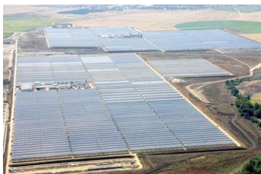
Abengoa社が運営する同規模の発電所

* フィード・イン・タリフ制度：再生可能エネルギー利用促進のための優遇価格電力買取制度