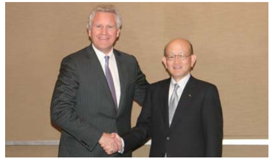
GE ジェフリー・イメルトCEOと伊藤忠商事 岡藤社長

2010年5月、伊藤忠商事とGEは全世界の再生可能エネルギー分野での共同投資案件発掘に関して包括的に提携することで合意し、覚書を締結しました。再生可能エネルギー分野における世界規模での投資機会の拡大を見込んでパートナー関係を強化し、これまでにGEとともに2つの風力発電事業に参画しています。