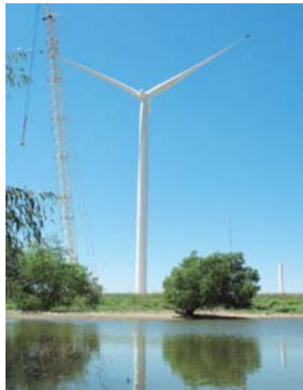
Keenan II 風力発電所

2010年10月にGEと共同で出資したオクラホマ州のKeenan II風力発電所の総発電容量は152MW(2.3MWの風力発電機66機)となり、Oklahoma Gas & Electric Companyとの間に20年間の売電契約を締結、オクラホマ州の約45,000世帯に電力供給を行います。これにより年間約413,000トンの温室効果ガス削減が期待されています。2010年12月より商業運転を開始し、本発電所の運転・保守は伊藤忠商事の100%子会社で、発電所運転・保守サービス会社の世界最大手であるNAES社が行っています。