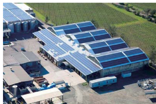
SolarNet 販売・施工事例 カリフォルニア州 Beringer Vineyards

* システムインテグレーター：太陽電池モジュールと付帯機器を組合わせた太陽光発電システムの設計、販売、施工を行う業者の総称