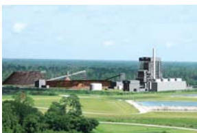
バイオマス発電所

米国IPP事業会社であるTyr Energy社を通じ、米国フロリダ州のバイオマス発電事業を開発し、出資・運営することとなりました。本発電所はフロリダ州北部に位置し、木くずや間伐材を燃料とする出力100MWの発電能力を持ち、バイオマス発電所としては米最大級となります。2013年の商業運転開始後はフロリダ州ゲインズビル市の電力会社との30年間の電力供給契約に基づき、約7万世帯に電力を供給します。運転・保守は伊藤忠商事100%子会社で世界最大手の発電所運転・保守サービス会社であるNAES社が行います。プロジェクトへの取組を通じ、再生可能エネルギーの開発・投資を積極的に展開していきます。