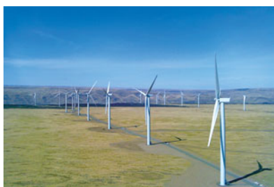
シェファード・フラット風力発電所

同事業は、当社とGEとの間で締結した「全世界の再生 可能エネルギー分野の投資に関 する業務提携」の覚書に基づ く2件目の案件となります。