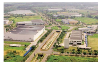
カラワン工業団地

近隣の村の乳幼児への離乳食支給、中高生への奨学金支給等の直接的な支援に止まらず、ボゴール農科大学の協力のもと、団地内に農業公園を設置し、周辺農民に付加価値の高い野菜栽培やなまぎ養殖等の技術指導や環境改善プログラムも実施しています。また、農業公園内ナースリーで育てた年間1万本超の苗木を工業団地内緑地や周辺村落等に植樹する等、地域社会に根ざした団地運営に努めています。