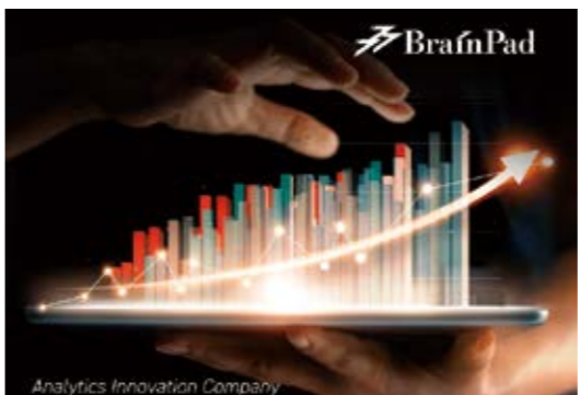
(株)ブレインパッド データ活用を通じ企業のDXを支援