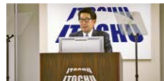
アナリスト・機関投資家向け決算説明会