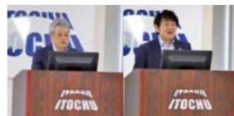
分野別説明会(情報・金融カンパニー・第8カンパニーにおけるデジタル戦略)