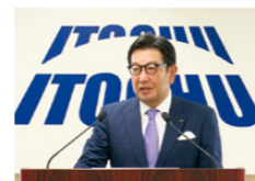
アナリスト・機関投資家向け決算説明会

*1 アナリスト・機関投資家向け決算説明会には、2024年4月3日に開催した経営方針に関する説明会を含んでいます。