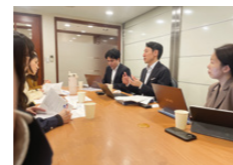
機関投資家向け個別ミーティング

ステークホルダーの皆様との積極的な対話を通じた適切な情報の発信や、経営陣に対する市場の声をフィードバックにより、企業価値向上を支援しています。